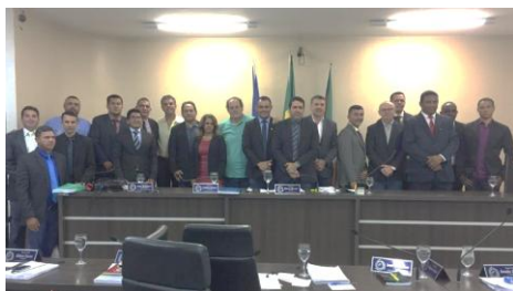
Vereadores e Representantes reunidos em Câmara municipal de Araguaína

automóveis de representantes comerciais, e ainda do Projeto de Lei complementar nº 5/2015 de autoria do Senador Paulo Paim, que trata sobre o novo enquadramento equiparando a função de representação comercial às atividades correlatas.