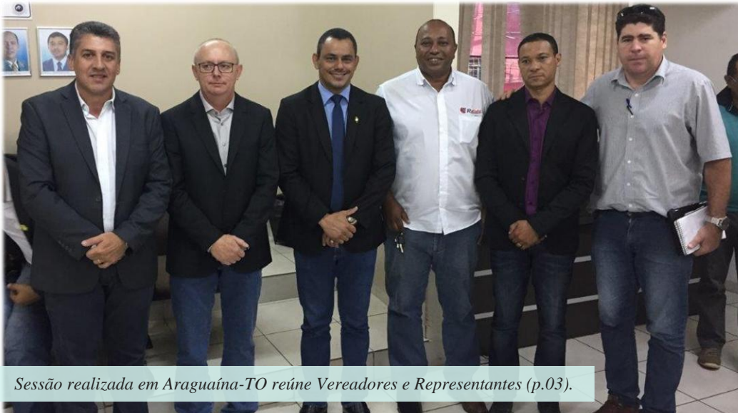
Sessão realizada em Araguaína-TO reúne Vereadores e Representantes (p.03).