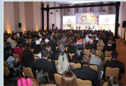
Cerimônia de Abertura da Conferência, com a presença de ministros do Tribunal de Contas da União.